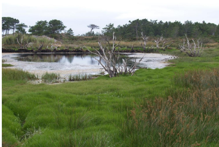
Lagoa na punta de Quilmas