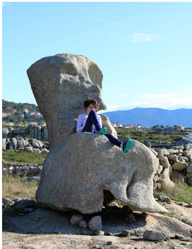
Curiosa rocha no litoral da Curra

Este tramo da costa de Carnota está protexida no LIC “Carnota-Pindo”.