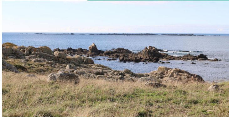
Punta da Lomba