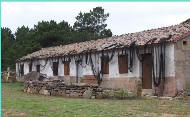
Chabolas da praia de Quilmas ambientadas para a rodaxe dunha película.

Unha distancia de 4 km pola estrada que se convirte nuns 7 km pola beira do mar, aos que hai que engadirlle a falta de camiños e a irregularidade do terreo, para facer dela unha andaina de varias horas.