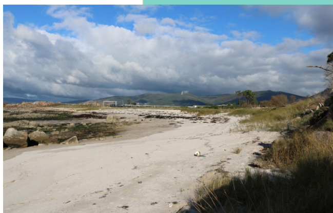
Praia de Corna Becerra