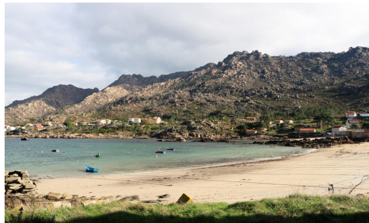
Praias de Quilmas