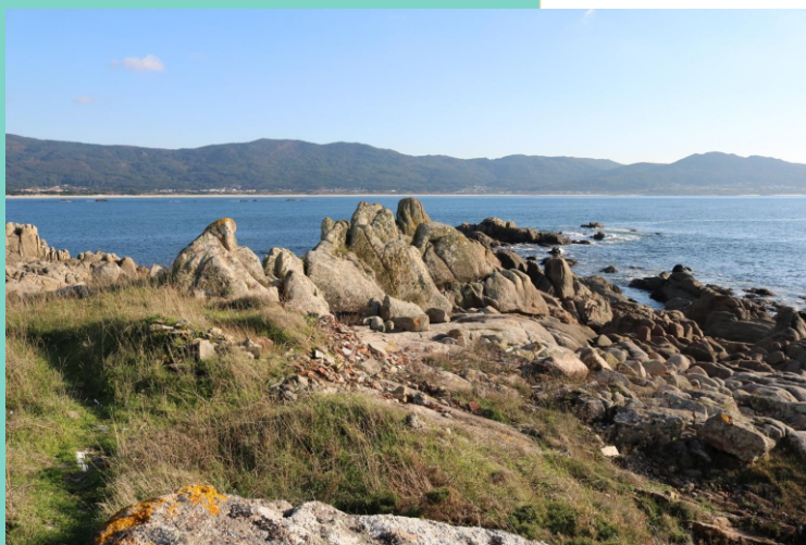
Punta de Caldebarcos. Outeiro Alto.