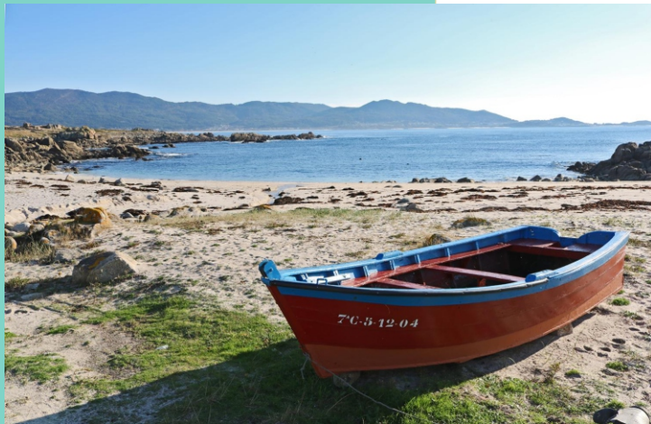
Praia da Insuela.