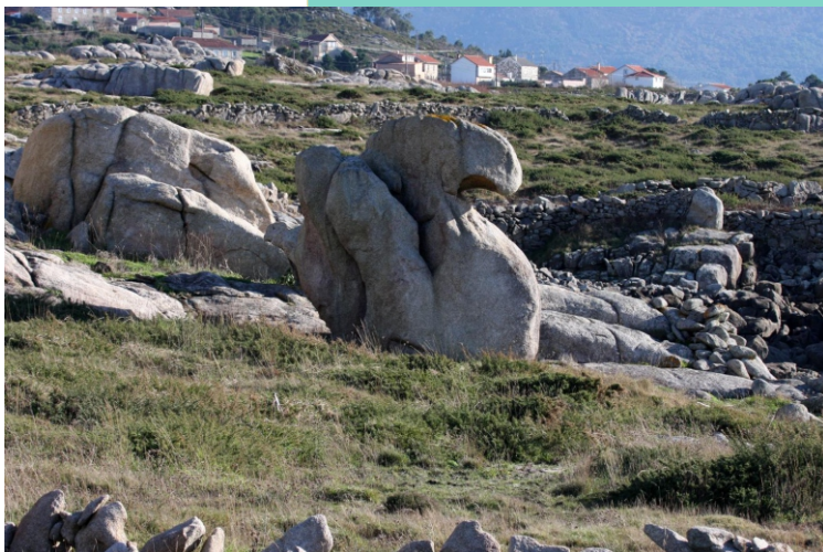
Punta e illas da Curra