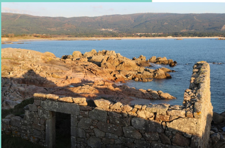
O Rubio, na Punta de Caldebarcos