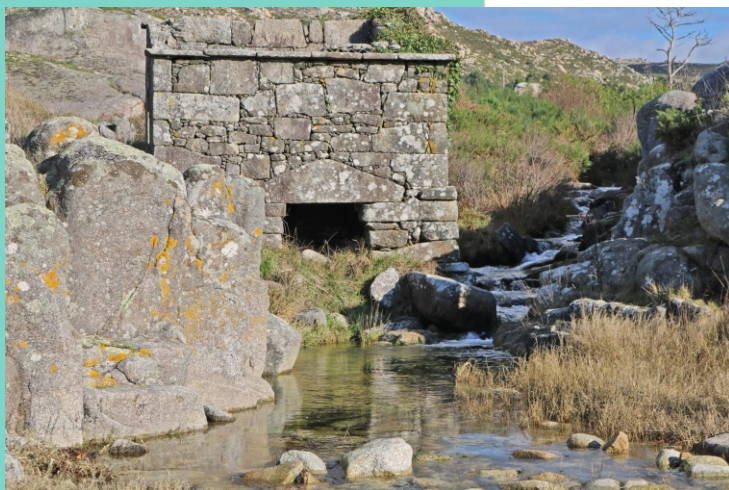
Rego dos Muíños