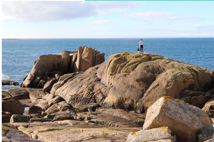
Costa de Cabra. Con este nome coñécese un tramo de costa rochosa con moitos baixos e illotes a algúns areais solitarios (Carballiños, Insuela ou Porto negros...). Abondan as algas que son recollidas para a industria.