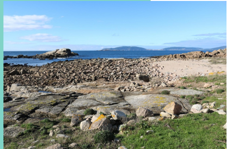
Praia do Pedrullo