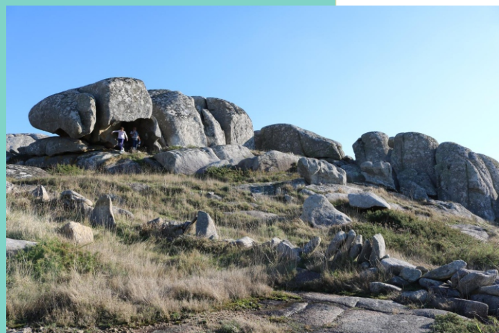
Punta do Garamelo