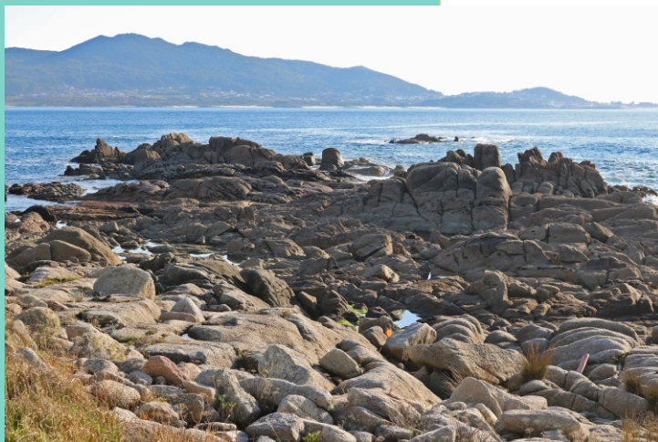
Punta de Caldebarcos