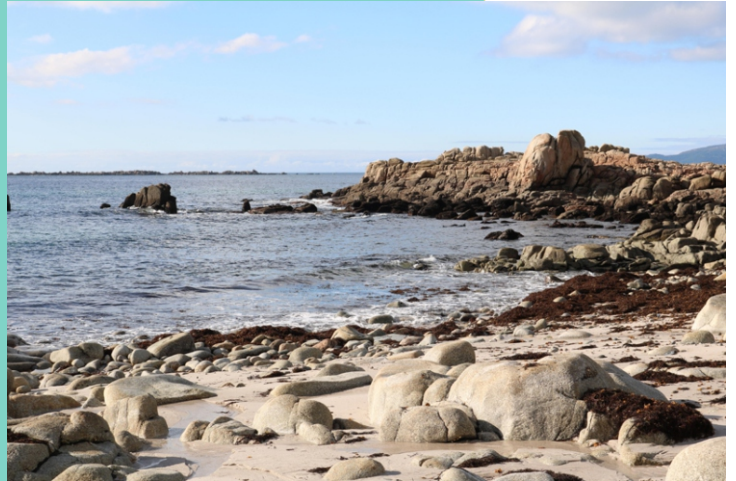
Punta e praia dos Carballiños