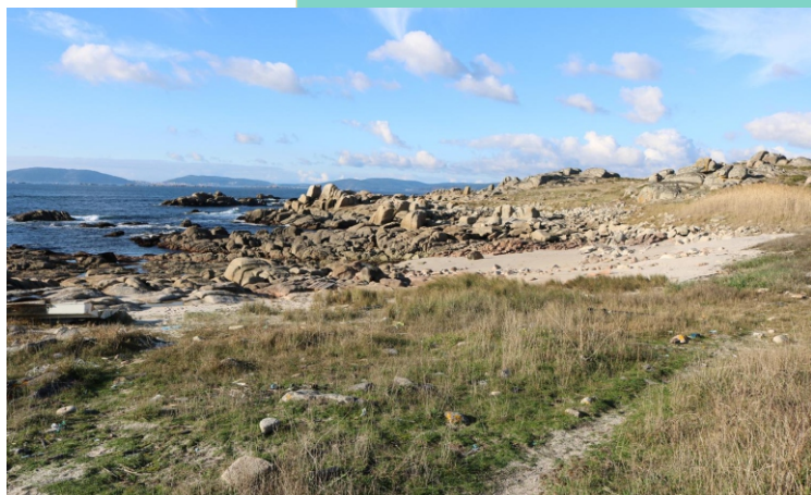
Portiño de Panchés