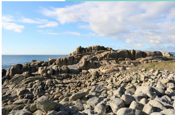
Punta da Pedra Loira