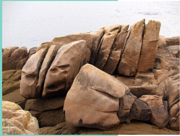
Rochas traballadas polo mar na punta de Quilmas.