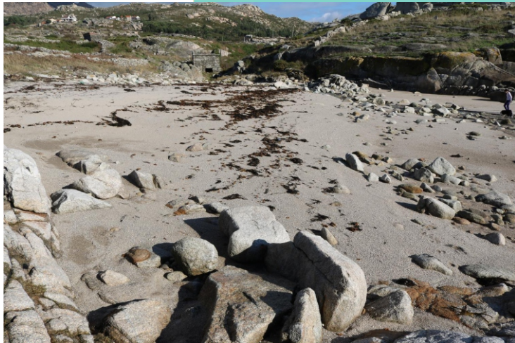
Praia do rego dos Muíños (enseada da Curra)