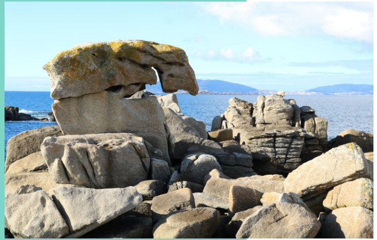
Punta do Carreiro de Luce