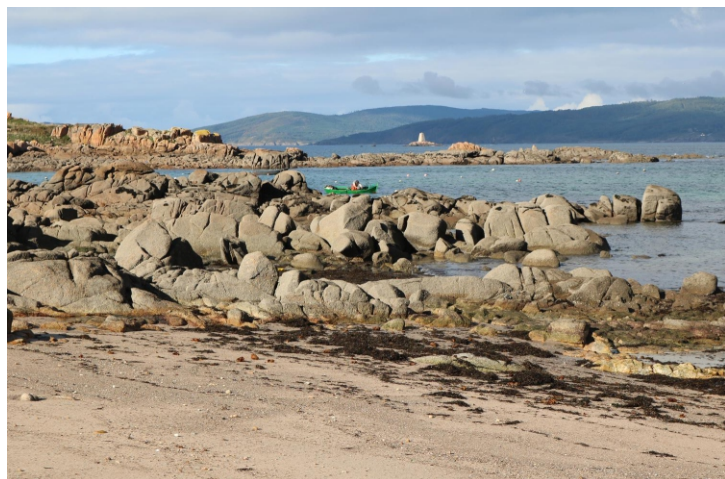
Cons na praia de Quilmas. Detrás a punta e o Petón dos Turcos.