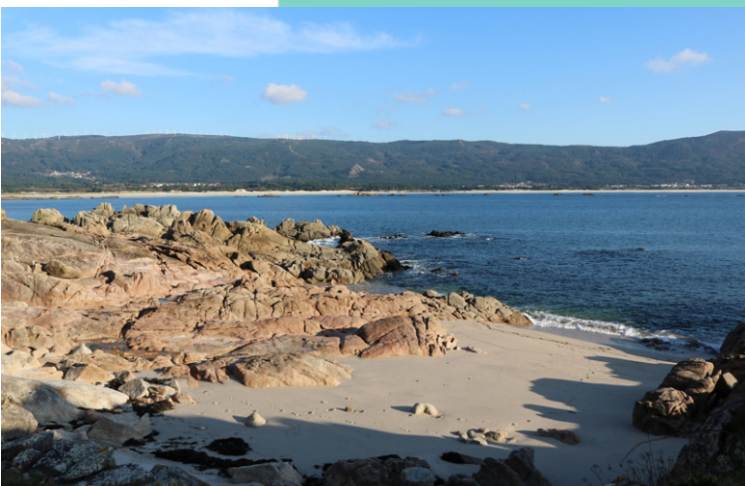
Praia do Almacén