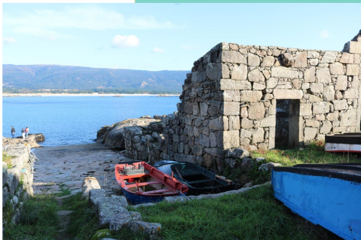
A punta de Caldebarcos acolle un pequeno porto (A Rambla), chabolas dos mariñeiros e restos de factorías de salga.