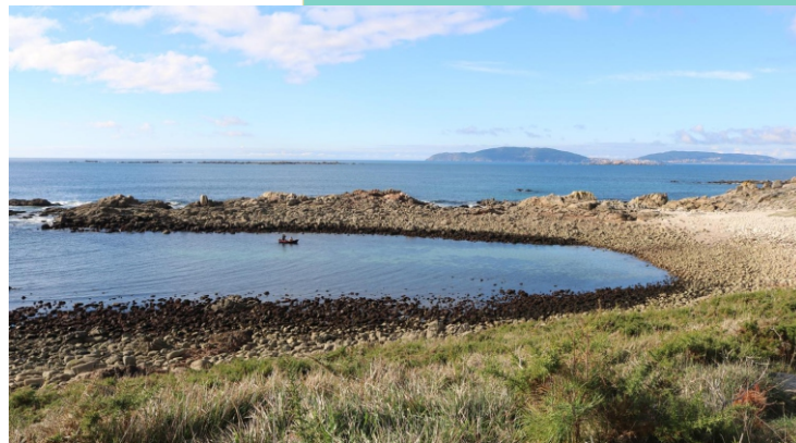
Porto dos Negros.